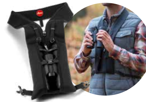
Nouvelle courroie Adventure Strap en série